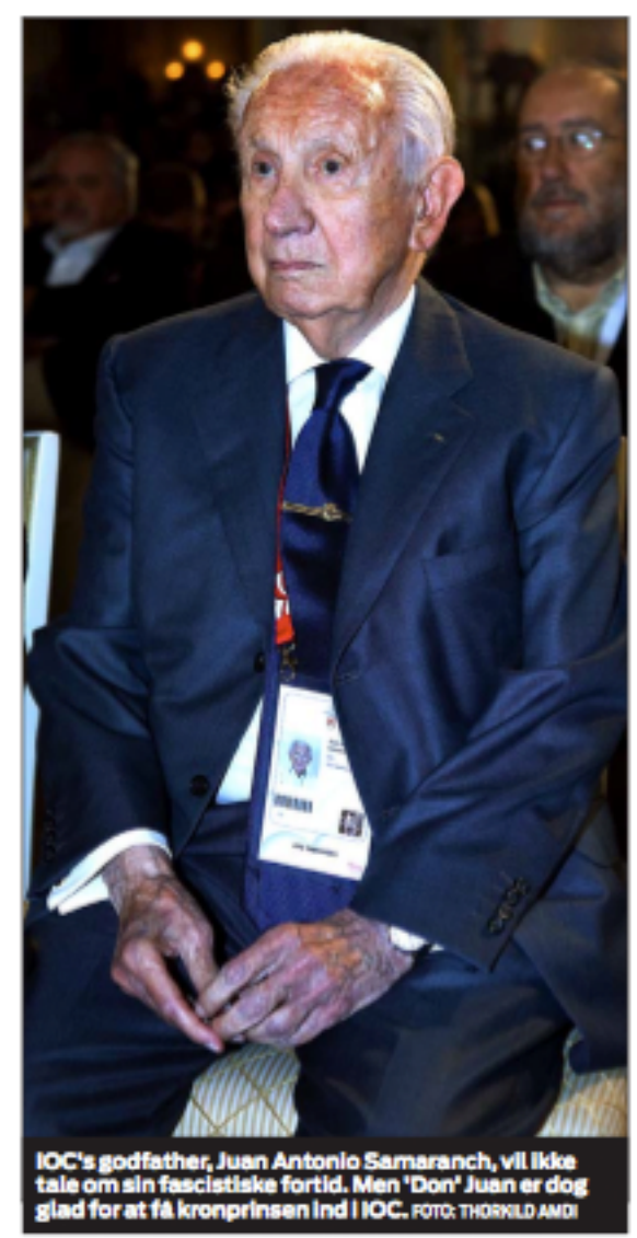
IOC's godfader, Juan Antonio Samaranch, vil ikke tale om sin fascistiske fortid. Men 'Don' Juan er dog glad for at få kronprinsen ind i IOC.

putere op, som kongressgæster frit kunne benytte i pauserne til at tjekke mail eller læse nyheder på nettet. Pengehvidvaskning En af gæsterne loggede ind på en privat bankkonto i banken First Caribbean International Bank, der har hovedsæde i Bahama. Det skete onsdag eftermiddag klokken 16.26. Banken har specialiseret sig i at levere konti, der bruges til 'skatteplanlægning' til kunder fra hele verden. Lige netop First Caribbean International Bank blev for blot et år siden ved en retshøring i Belize anklaget for pengehvidvaskning. Me-