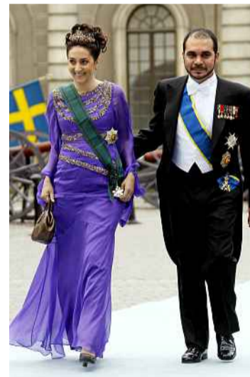
KONGELIG UTFORDRER: Ali bin Al Hussein av Jordan ankommer her sammen med prinsesse Rym Ali Storkyrkan i Stockholm i forbindelse med det svenske kronprinsparets bryllup.