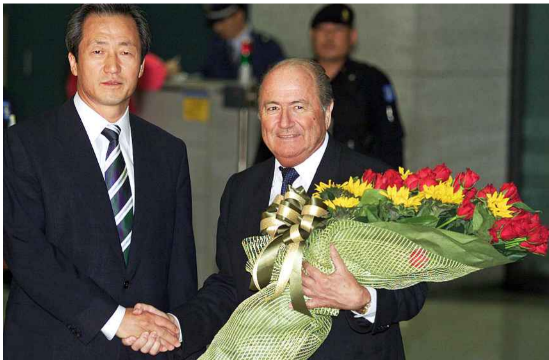
KAMP OM MAKTA: FIFA-president Sepp Blatter (t.h.) er mektig lei gjentatte angrep fra visepresident Chung Mong-joon (t.v.). Nå håper Blatter å bli kvitt den styrtrike koreaneren en gang for alle, ved å støtte en motkandidat blant sine venner i Qatar og andre Gulf-stater.