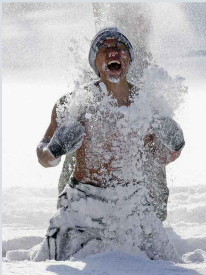
FÅR KJØRT SEG: Så du synes det er kaldt på vei til jobb om dagen? Sør-koreanske soldater ble i går drillet i snøbading under en vinterøvelse.