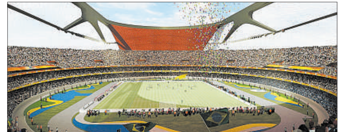
DOIS ÂNGULOS de um projeto de reforma do Morumbi: São Paulo corre risco de ficar fora da Copa

— Se a corrupção é definida como o abuso de poder público para ganhos privados, então, na minha opinião, a Fifa criou um modelo de corrupção global institucionalizada. A minha análise de documentos mostra que, ao longo das décadas, a entidade buscou e alimentou a corrupção, especialmente em países em desenvolvimento. Parlamentares e promotores públicos sofreram pressões diante da insistência da Fifa em que seus assuntos não podem ser sujeitos a interferências por parte de governos eleitos. Juntamente com o COI [Comitê Olímpico Internacional], a Fifa reivindica "autonomia" para o esporte, com o frágil argumento de que não se deve permitir que governos interfiram na "independência" das federações desportivas. A risível sugestão de que essas federações, frequentemente manchadas por fraudes eleitorais, corrupção e escândalos financeiros, devam ficar acima da lei, é aceita pela maioria dos governos, na maioria das vezes. Eu não estou, aqui, criticando o futebol — os torcedores, os jogadores, os treinadores dos clubes, que não têm nada a ver com isso —, mas os administradores do esporte.