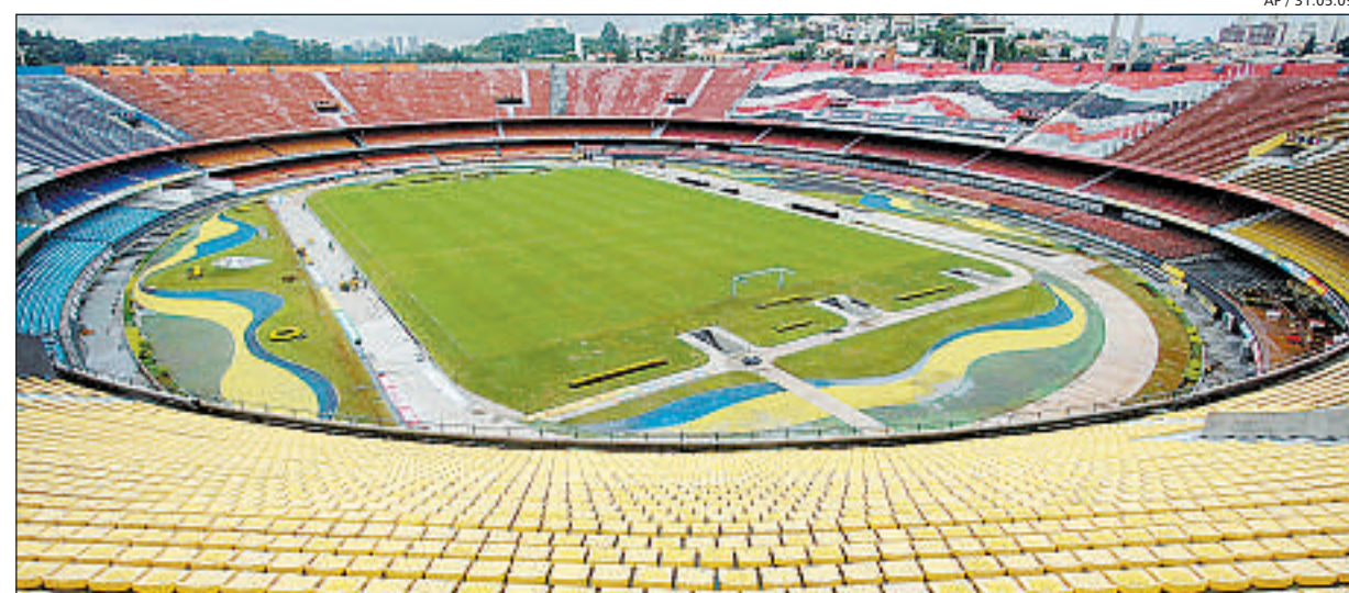
31.05.09 O ESTÁDIO DO MORUMBI é um dos pontos de divergência entre autoridades e organizadores da Copa

— Meu próximo livro será sobre o crime organizado internacional e sua relação com os esportes através de esquemas fraudulentos. Eu parto de uma definição sobre o que é o crime organizado: uma conjunção de liderança forte, lealdade ao grupo, comprometimento com o objetivo de planejar atos criminosos para ga-