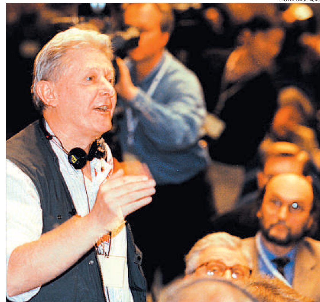
ANDREW JENNINGS numa entrevista coletiva do COI: o jornalista britânico está barrado na Fifa

nar dinheiro e, uma coisa que o diferencia de outros grupos, que são as redes de proteção. Esse tipo de criminoso busca comprar gente influente, como um juiz, um político. É aí que se estabelecem esquemas de fraude e de pagamento de propinas. E na minha análise a Fifa pode ser incluída nessa definição.